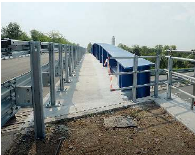
Pista ciclabile. Il tracciato della pista ciclopedonale che sarà costruita