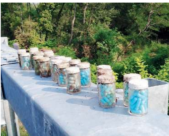
La droga. I contenitori con le pastiglie trovate durante la pulizia delle rampe